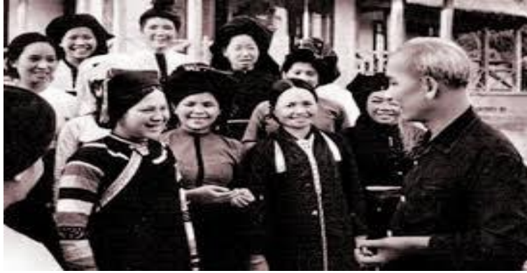
Bác Hồ gặp gỡ Hội LHPNVN