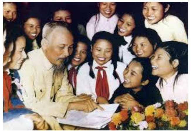
Bác Hồ với thiếu nhi