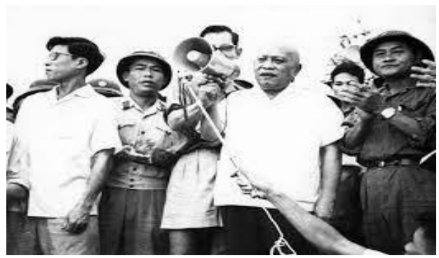
Một số hình ảnh Bác Tôn với nhân dân