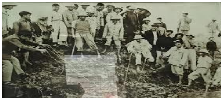
Bác Hồ cùng với nhân dân tát nước vào ruộng để chống hạn hán

Theo Người, Đảng và mỗi cán bộ, đảng viên phải gần gũi Nhân dân, quan tâm đến những việc nhỏ cho đời sống hằng ngày của Nhân dân. “Chính sách của Đảng và Chính phủ là phải hết sức chăm nom đến đời sống của nhân dân. Nếu dân đói, Đảng và Chính phủ có lỗi; nếu dân rét là Đảng và Chính phủ có lỗi; nếu dân dốt là Đảng và Chính phủ có lỗi; nếu dân ốm là Đảng và Chính phủ có lỗi. Vì vậy, cán bộ Đảng và chính quyền từ trên xuống dưới, đều phải hết sức quan tâm đến đời sống của nhân dân. Phải lãnh đạo, tổ chức, giáo dục nhân dân tăng gia sản xuất và tiết kiệm. Dân đủ ăn đủ mặc thì những chính sách của Đảng và Chính phủ đưa ra sẽ dễ dàng thực hiện. Nếu dân đói, rét, dốt, bệnh thì chính sách của ta dù có hay mấy cũng không thực hiện được”.