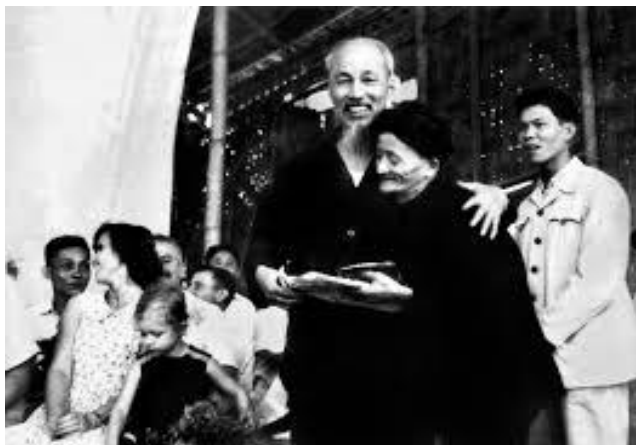
Bác Hồ tặng quà cho các cụ

Bên cạnh đó Chủ tịch Hồ Chí Minh còn thể hiện rõ tinh thần yêu trẻ, kính già, trọng phụ nữ.