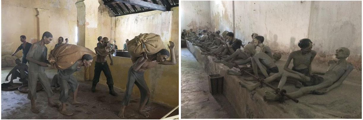
Một hình ảnh về nhà tù Côn Đảo