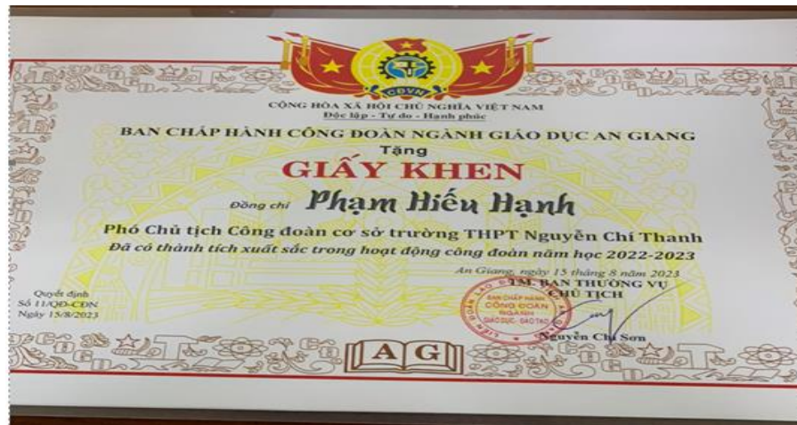
Hình ảnh bằng khen thành tích

Thầy Phạm Hiếu Hạnh là một thầy giáo dạy môn Lịch Sử, bằng niềm đam mê, nhiệt huyết với nghề, sự nỗ lực không ngừng, bằng kiến thức chuyên môn đã được bồi tựu qua năm tháng, thầy đã được các anh em đồng nghiệp trong nhà trường, và lãnh đạo trường yêu quý và kính trọng. Trong những năm đã qua, với vai trò là một người tổ phó chuyên môn, Phó chủ tịch công đoàn thầy luôn tận tâm giúp đỡ các đồng nghiệp trong tổ, và các công đoàn viên đang gặp khó khăn, sẵn sàng lắng nghe đóng góp ý kiến từ các thành viên tổ cũng như là của đồng nghiệp để mình chứng cho điều đó thầy đã thành tích cao trong công tác giảng dạy như ôn thi học sinh giỏi,...v.v. và được vinh danh cá nhân có thành tích xuất sắc trong hoạt động công đoàn năm học 2022 – 2023.