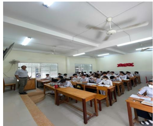
Hình ảnh dạy trên lớp của Thầy

Đối với tập thể sư phạm nhà trường thầy luôn là tấm gương sáng để giáo viên trẻ như em noi theo, luôn đi đầu trong mọi công tác của nhà trường. Với học sinh thầy là một người mẫu mực, hết lòng thương yêu quan tâm các em. Thương học sinh như con cháu trong nhà, quan tâm tới các em học sinh có học lực yếu, kém, học sinh có hoàn cảnh khó khăn...luôn tận tình giúp đỡ và hỗ trợ các em nhanh chóng và kịp thời. Đối với các em có học lực yếu, kém thầy luôn chỉ dạy nhiệt tình,