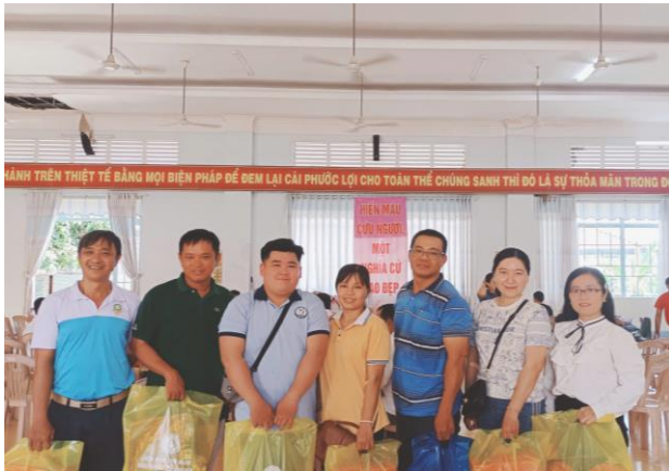
Hình ảnh: tham gia hiến máu tình nguyện

Đối với đồng nghiệp trong đơn vị đặc biệt là những hoạt động của công đoàn ngành, đơn vị phát động luôn gương mẫu đi đầu trong các phong trào thi đua của công đoàn. Xác định được phong trào thi đua chính là động lực trong việc thực hiện các mục tiêu nhiệm vụ, trong thời gian qua, thầy đã phối hợp cùng đơn vị thực hiện tốt mọi nhiệm vụ được giao. Phát huy tối đa tinh thần đoàn kết, tương thân tương ái, cộng đồng trách nhiệm, tính tiên phong gương mẫu, tác phong của người tiên phong và nhiệt tình, năng động của cán bộ, công nhân viên chức, người lao động, gắn với tiêu chí, tiêu chuẩn cụ thể ở từng vị trí công tác; tăng cường sự đoàn kết thống nhất trong lãnh đạo, chỉ đạo, điều hành, tổ chức thực hiện nhiệm vụ, góp phần xây dựng đơn vị trong sạch vững mạnh.