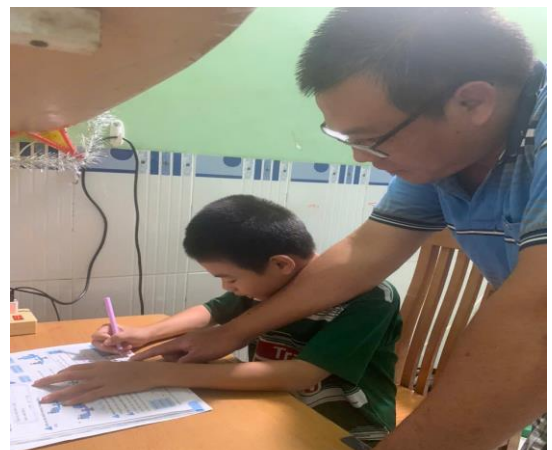
Hình ảnh Thầy đang ôn bài cho con