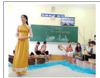
Ảnh. Tiết dạy bài: Chợ nổi – nét văn hóa sông nước miền Tây