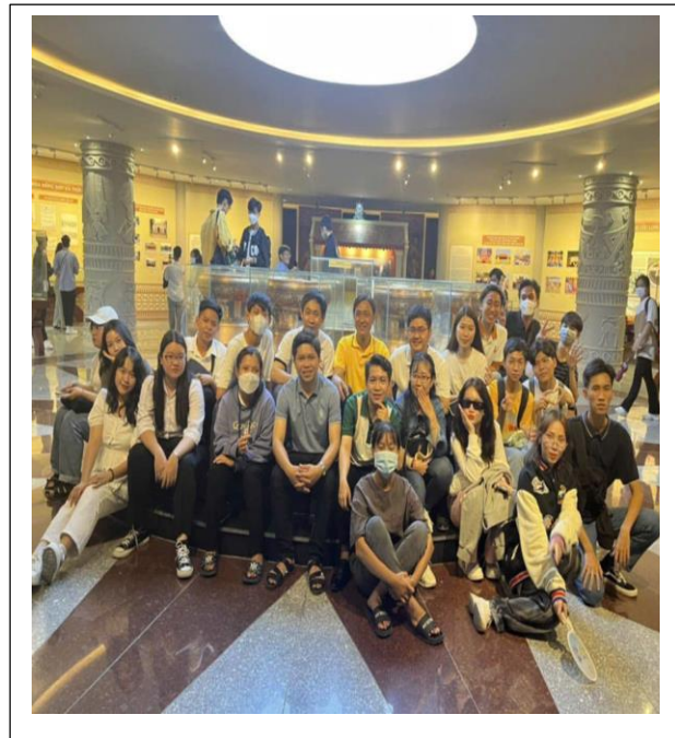
Ảnh. Trải nghiệm tư vấn hướng nghiệp tại Cần Thơ ( Thầy Y mặc áo xanh lá)

Trong tất cả các hoạt động phong trào của trường, thầy Y đều nhiệt tình tham gia và đạt được nhiều thành tích ấn tượng. Tuy không thể liệt kê hết, nhưng dưới đây là một số thành tích nổi bật: Trong năm học 2021-2022, thầy xuất sắc đạt giải sáng kiến kinh nghiệm cấp tỉnh (mặc dầu chỉ mới công tác 1 năm). Tiếp theo, trong hai năm học 2022-2023 và 2023-2024, thầy được công nhận là viên chức hoàn thành xuất sắc nhiệm vụ, đạt danh hiệu Chiến sĩ thi đua, và là giáo viên chủ nhiệm giỏi cấp trường. Thầy cũng xuất sắc đạt giải nhì trong cuộc thi chính luận bảo vệ nền tảng tư tưởng của Đảng năm 2024 , và Hội liên hiệp thanh niên Việt Nam huyện Phú Tân, tuyên dương thầy là thanh niên tiêu biểu trong công tác tình nguyện năm 2023 . Bên cạnh đó, thầy còn đạt giải B trong hội thi giáo viên làm bài giảng điện tử năm học 2022-2023 và vinh dự được công nhận là giáo viên tiêu biểu năm học 2023-2024 . Với thầy, việc học tập và làm theo tư tưởng Hồ Chí Minh không chỉ là nghĩa vụ mà còn là sự lựa chọn để thực hiện lý tưởng sống. Giải nhì cấp tỉnh trong hội thi học tập và làm theo tư tưởng, đạo đức, phong cách Hồ Chí Minh chuyên đề 2023 và tuyên truyền tác phẩm của đồng chí Tổng bí thư Nguyễn Phú Trọng năm 2023 đã khẳng định những nỗ lực và tâm huyết của thầy.